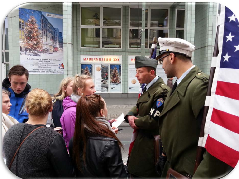
Her sjekkes hva vaktene på Checkpoint Charlie kan om Berlin!